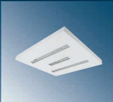
RPF-251T3CPWK - I700P24N2