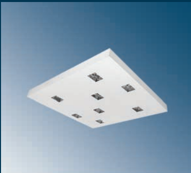
RPF-251T8CDWK - I700P24N2