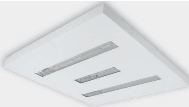
LEDCell-Tile Recessed For LED-3Cell- Parallel